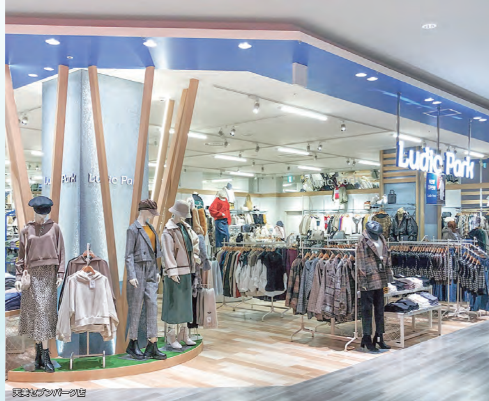
天美セブンパーク店

いつまでもかわいく輝きたい女性に向けて、毎日のHAPPYを演出します。エレガンスをベースに程よくトレンドを織り交ぜながらON&OFFあらゆるシーンも自分らしく楽しめる上品で女性らしいファッションを提案します。