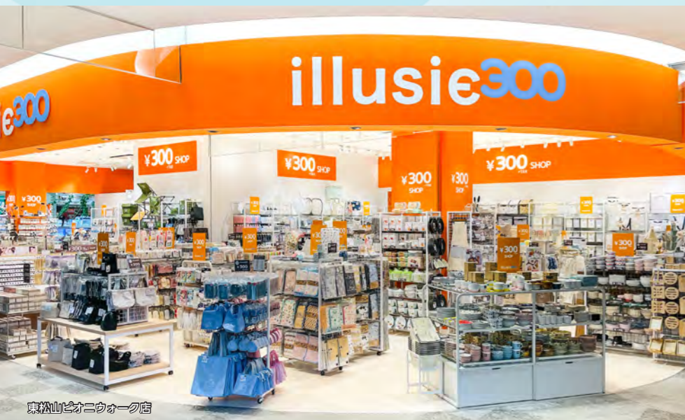
東山ヒルズウォーク店