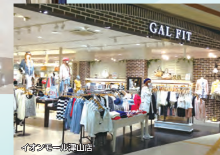
イオンモール津山店

「フェミニン」をキーワードに、ベーシックでリラックス感のある大人のカジュアルスタイルを提案します。