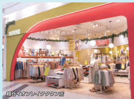
越谷イオンレイクタウン店

遊び心を程よく取り入れた自分らしいファッションを、楽しくセレクトできるショップです。エレガンス・クール・カジュアルまで幅広い客層へ向けた最新トレンドと、着まわしのきくベーシックアイテムをお手頃プライスで提案します。