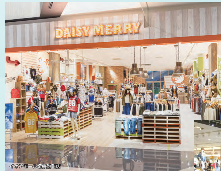
イオンモール津沼町店

「MY BAGを探す楽しさや、見つけた時の喜びを共有できるBAG SHOP」自分のスタイルを確立した大人の男女に、「オンリーワン」のバッグを提案します。