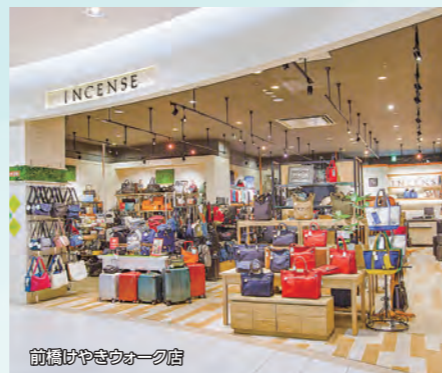
前橋はやきウォーク店

「フェミニン&カジュアル」をテーマに、上品さと着心地を大切にラージサイズSHOPです。