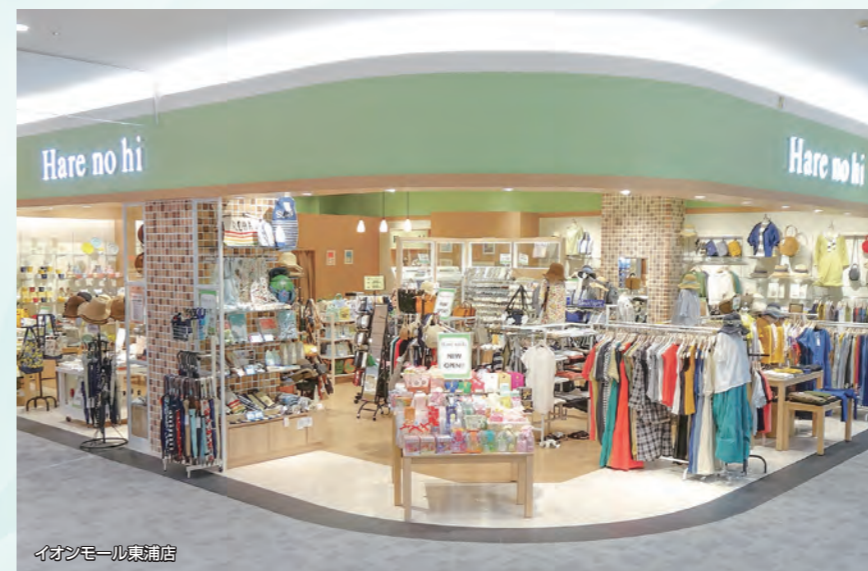
イオンモール東浦店