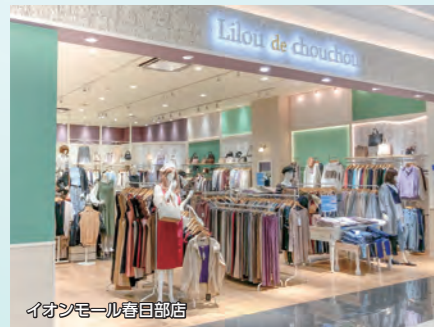
イオンモール春日部店