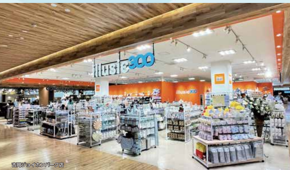
吉岡ジョイイオンパーク店