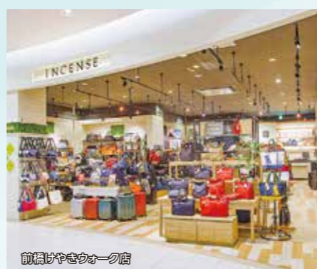
前橋はやまきオーフ店