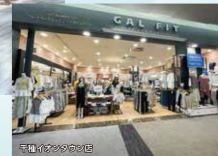
千種イオンタウン店

「フェミニン」をキーワードに、ベーシックでリラックス感のある大人のカジュアルスタイルを提案します。