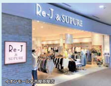
イオンモール名古屋栄店

普段も特別な日もかわいくなりたい。扉を開くたびに“ときめきを感じる”お洋服で、クローゼットをいっぱいになりたい。そんな、あなたの願いに寄り添えるように“愛らしくて愛嬌のある魅力的な女の子”をテーマに、お砂糖菓子みたいな甘さと、ちょっぴりダークでかわいらしさのあるお洋服をあなたに提案します。