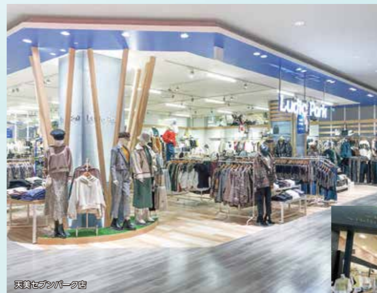
天竺セブンパーク店

「フェミニン&カジュアル」をテーマに、上品さと着心地を大切にラージサイズSHOPです。