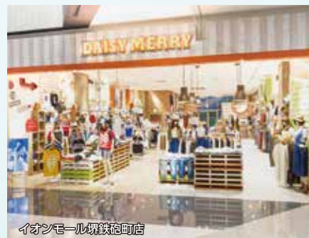
イオンモール堺東店