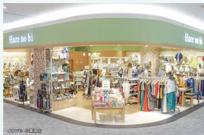
イオンモール東浦店

「MY BAGを探す楽しさや、見つけた時の喜びを共有できるBAG SHOP」自分のスタイルを確立した大人の男女に、「オンリーワン」のバッグを提案します。