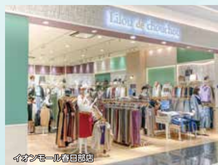
イオンモール春日部店

大人の心と少女の心を持ち合わせたいくつになってもかわいくオシャレでいたい女性に向けて…かわいだけでなく、どこかボーイッシュ、ほんのりガーリーと、遊び心を取り入れた今欲しいリアルクローズを手頃なプライスで提案します。